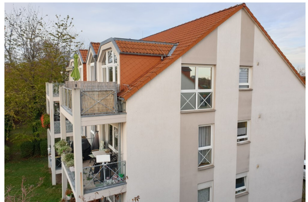
Blick vom Balkon auf das baugleiche Nachbarhaus